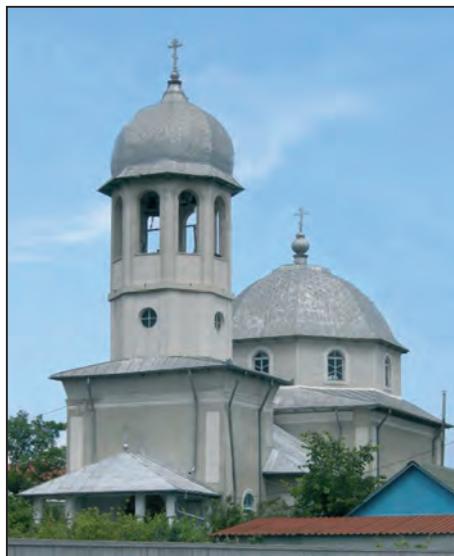
Fig. 12. Biserica lipovenească, Sulina, 2008