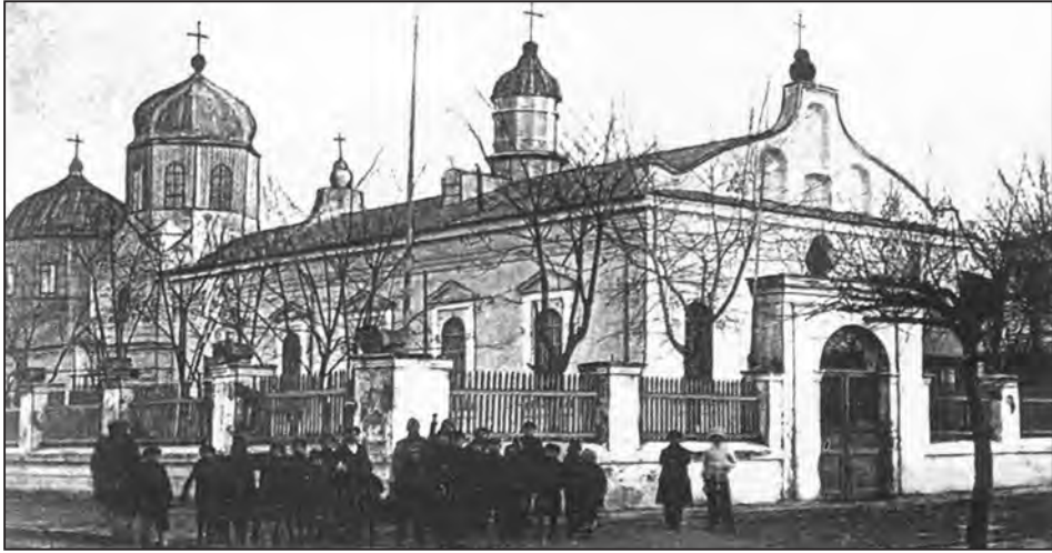
Fig. 5. Biserica grecească și biserica catedrală (vechea biserică ruso-română), Sulina, 1903