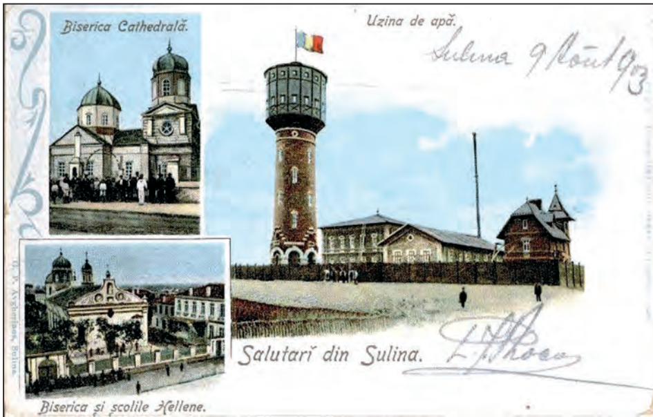
Fig. 6. Carte poștală cu cele două biserici construite pe același teren: biserica catedrală „Sf. Nicolae” și biserica grecească „Sf. Nicolae”, Sulina, 1903

și Comisia Europeană a Dunării 9 . Biserica nu are turlă în timpul stăpânirii turcești. După alipirea Dobrogei la România, bisericile i se ridică o mică turlă deasupra naosului.