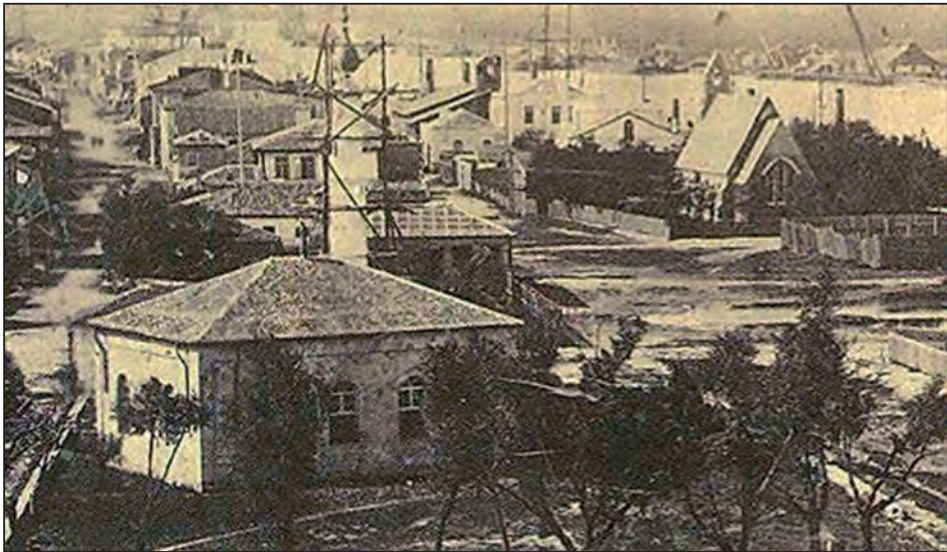
Fig. 8. Biserica anglicană și moscheea, astăzi dispărute, văzute din vechiul far, Sulina, a doua jumătate a sec. XIX

Biserica anglicană este construită în anul 1869 din subvențiile C.E.D., pentru funcționarii săi, pe malul Dunării, în apropierea cartierului comisiei.