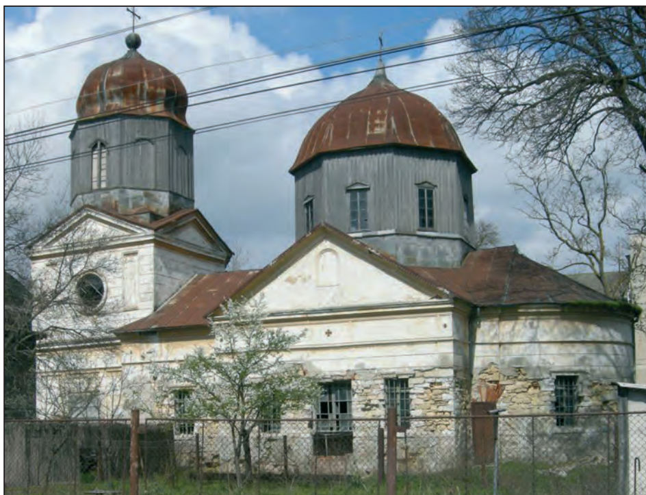
Fig. 4. Biserica ortodoxă veche „Sf. Nicolae”, Sulina, vedere sud, 2008