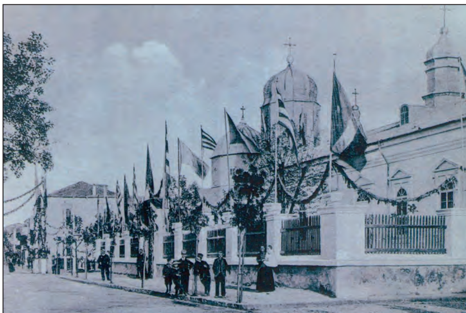
Fig. 3. Biserica catedrală „Sf. Nicolae” , Sulina, 1908