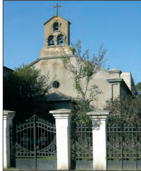
Fig. 7. Biserica catolică „Sf. Nicolae”, Sulina, 2008

Biserica este în cult, deși, în Sulina, în prezent mai sunt doar câțiva catolici.