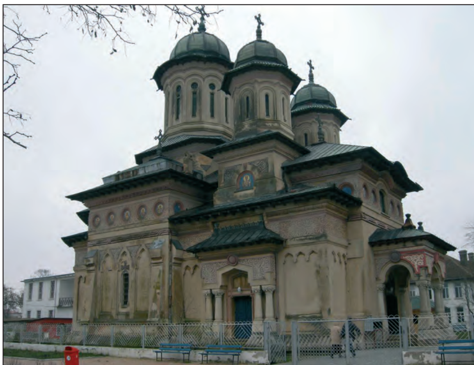
Fig. 9. Catedrala ortodoxă „Sf. Nicolae și Alexandru”, Sulina, 2008

biserica este sfințită, încununându-se acest efort uriaș de construire, care a durat un secol.