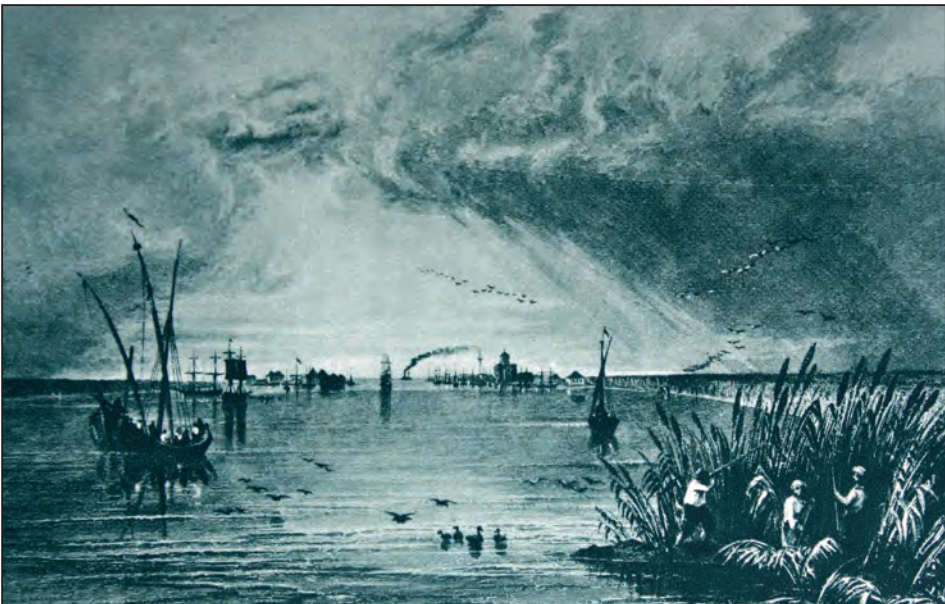
Fig. 2. „Gura Sulina”, gravură din volumul „The Danube”, de William Bettie M.D., cu ilustrații de W. Henry Bartlett, Londra, 1842

fluviului și se constituie Comisia Europeană a Dunării – C.E.D., inițial ca un organism provizoriu, cu mandat pentru doi ani, alcătuită din reprezentanții marilor puteri europene: Anglia, Franța, Austria, Prusia, Germania, Italia, Sardinia, Rusia și Turcia, dar care și-a prelungit existența până în preajma celui de Al Doilea Război Mondial.