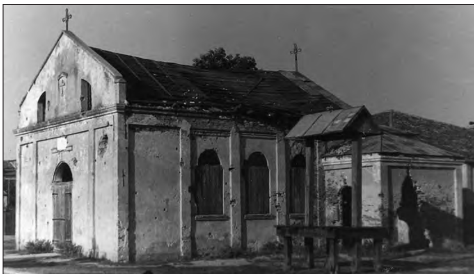
Fig. 10. Biserica armenească, astăzi dispărută, Sulina, 1958

Biserica armenească este construită în anii 1892-1893, în partea de vest a orașului, în cartierul armenesc. Amplasamentul ales, la intersecția a două străzi, oferă o bună vizibilitate bisericii.