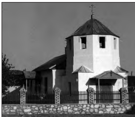
Fig. 11. Vechea biserică lipovenească, astăzi dispărută, Sulina, 1958

În anul 2001, dintre cei 4600 de locuitori din Sulina, 504 sunt lipoveni.