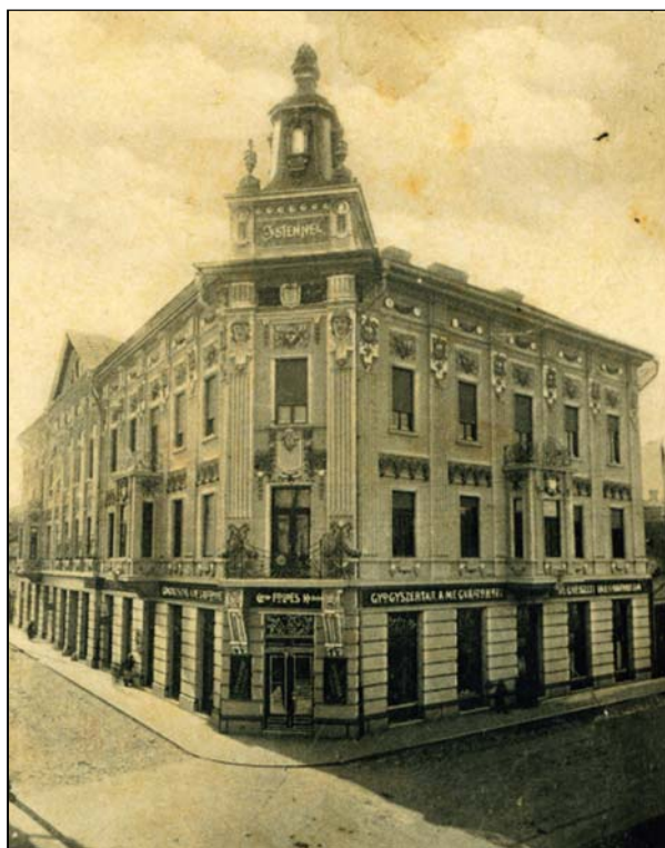
Palatul Földes Kelemen