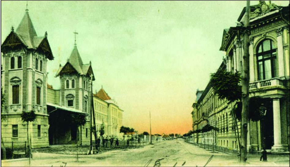
Teatrul de vara din Arad